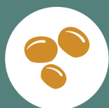
Tremoços Lupini Beans