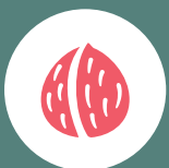
Frutos de casca Nuts