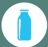
Lácteos Milk and Lactose